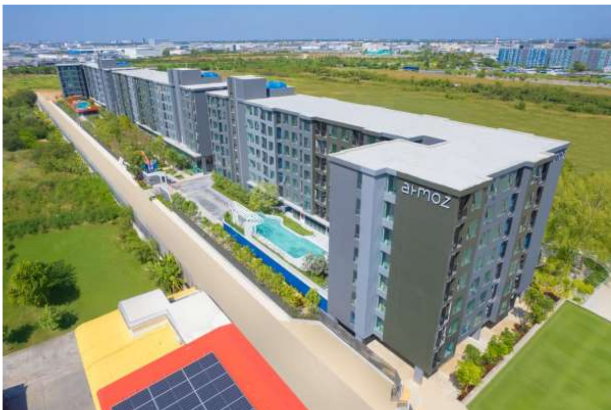
รูปที่ 1.3 สภาพโครงการในปัจจุบัน